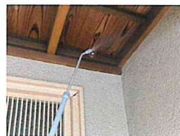
害虫ブロック技能者が施工します。