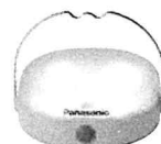
ソーラーランタン

みなさまの読み終えた本やリサイクル品のご寄付によって、 無電化地域にソーラーランタン(あかり)をお届けし、 あかりの輪を広げる活動です。ぜひご参加ください