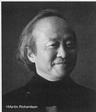
[指揮] 尾高忠明 Tadaaki Otaka, Conductor

今年生誕200年を迎える作曲家、アントン・ブルックナー。オーストリアの小村に生まれ、教会のオルガンを弾きながら音楽と神への愛を胸に生涯を送りました。遅咲きの作曲家であり、50歳を過ぎてからようやく作曲家として知られるようになったブルックナーの初期の作品は演奏される機会があまりありませんがブルックナー作品の全容を知る上で、最初の頃の作品は重要で、ブルックナーをレパートリーの中心に据える大阪フィルとしては欠かすことが出来ません。今回はブルックナーと同郷の先人・モーツァルトの交響曲と組み合わせての演奏。オーストリアの美しい自然の中で育った二人の天才の世界をお楽しみ下さい。