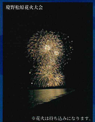
※花火は持ち込みになります。