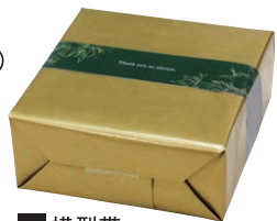
A 横型帯 (Thank you as always.)