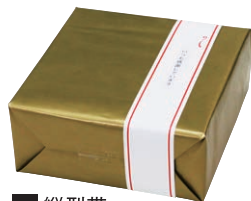
B 縦型帯 (いつも感謝しています)